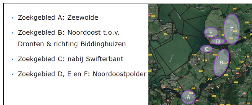
Fig 2 - zoekgebieden Flevoland