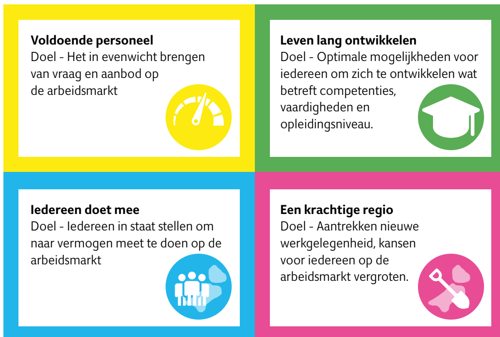
Strategische agenda Flevoland Werkt

Onder de noemer 'Flevoland Werkt!' wordt vanuit gemeenschappelijke vertrekpunten en een gedeeld gevoel van urgentie een strategische agenda met heldere doelen uitgevoerd om een brede bijdrage te leveren aan de realisatie van de inclusieve arbeidsmarkt in Flevoland. Een arbeidsmarkt waarin iedereen naar vermogen onbeperkt mee kan doen en niemand aan de kant staat. Alle inzet is vooral gericht op werkgevers en werknemers die gecoördineerde ondersteuning krijgen.