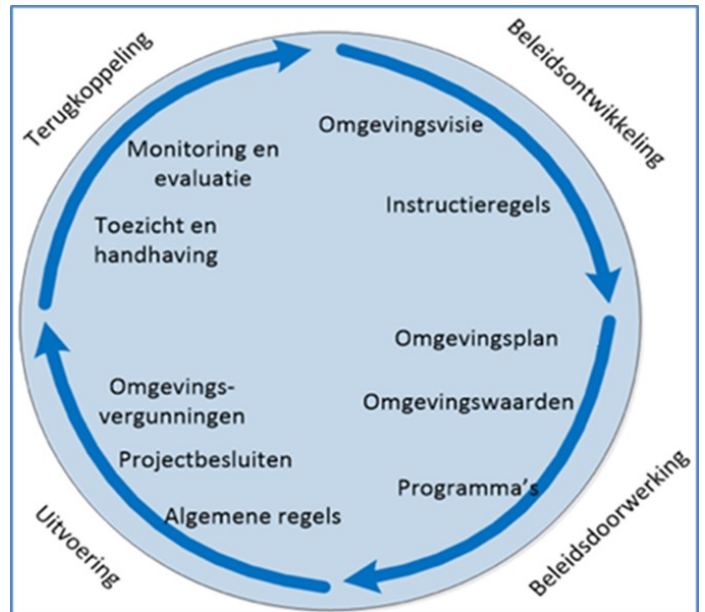
Figuur 1 Beleidscyclus

Hoofdstuk 2 gaat in op de doelstelling en het resultaat. Daarna leest u in hoofdstuk 3 de kaders voor de Omgevingsvisie. Hoofdstuk 4 gaat vervolgens in op de aanpak en planning. Tot slot staan in hoofdstuk 5 en 6 de verwachte kosten en risico's.