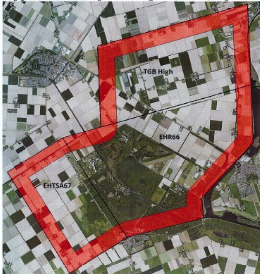
Figuur 1. De EHR66, EHTSA67 en TGB High met bufferzone

De belangrijkste randvoorwaarden die een directe relatie hebben met de Concept Gebiedsvisie, hebben, zoals aangegeven, te maken met het gebruik van het (gesloten) luchtruim, zie figuur 1.