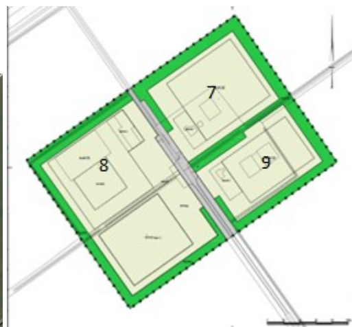
Luchtfoto van bestaande situatie en daarnaast de verbeelding van de nieuwe situatie (met huisnummers)