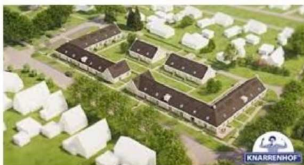
Het Hof van Emmen