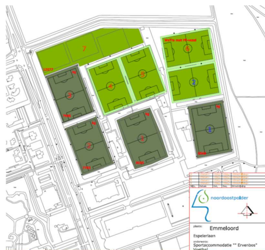
Figuur 1 Overzicht sportvelden Sportpark Ervenbos

Er is echter wel een aandachtspunt. Als gevolg van de intensieve benutting van het wetraveld als trainingsveld, is de staat van dit veld onvoldoende om ook op zaterdag als wedstrijdsveld in te kunnen zetten. Een wetraveld kan vaker benut worden dan een normaal natuurgrasveld. Dit is echter veel beperkter dan met een kunstgrasveld. De beschikbare uren op het wetraveld worden ruimschoots gebruikt voor de trainingen door de week en dus valt dit veld op de zaterdagen af. Daarom is het verstandig om dit wetraveld om te zetten naar een kunstgrasveld. Dit is als zodanig opgenomen in de perspectiefnota.