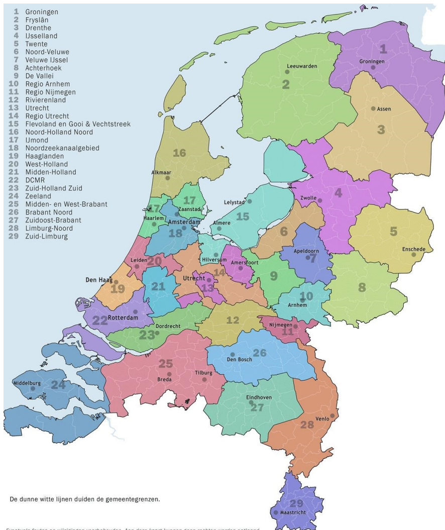
Figuur 2 Overzicht omgevingsdiensten.