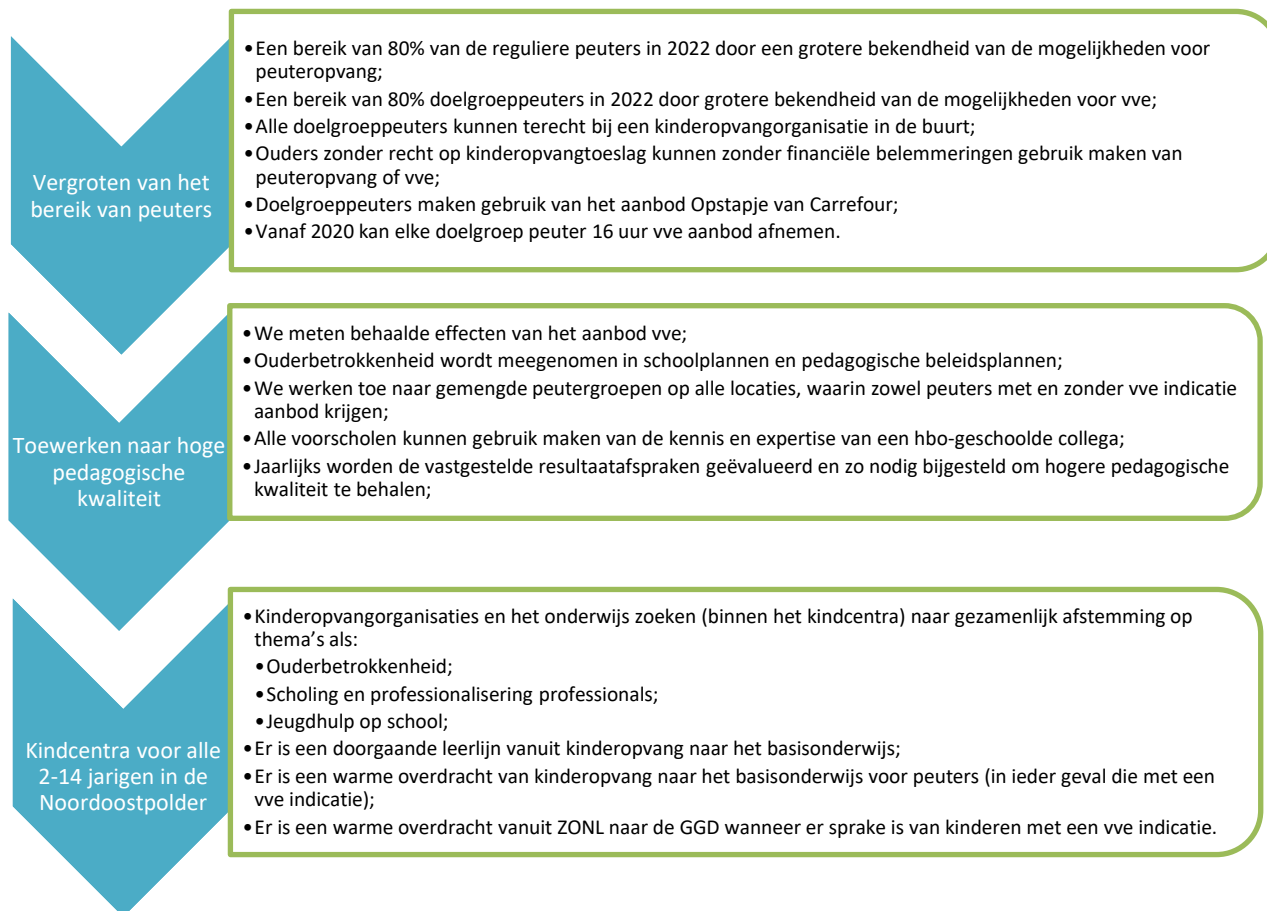
Figuur 1. Resultaatafspraken vve