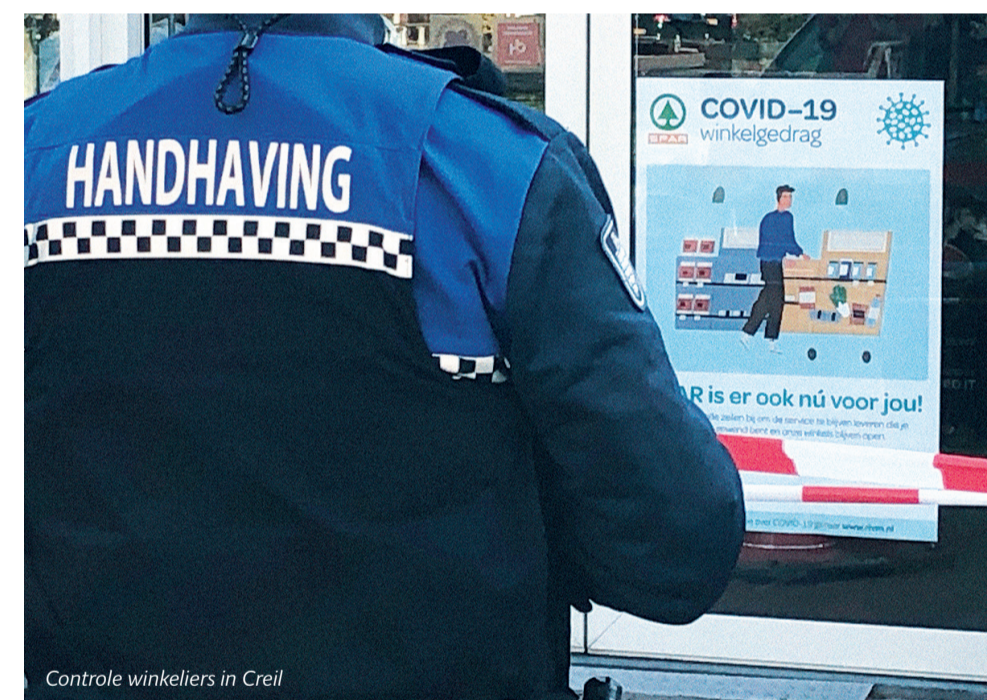
Controle winkeliers in Creil

Onze Boa's werken heel nauw samen met de politie. Daarnaast hebben ze regelmatig afstemming met de Boa's van Staatsbosbeheer en Natuurmonumenten. Het is belangrijk dat we elkaar snel weten te vinden en op één lijn zitten met elkaar.